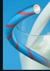
Vielweckschläuche für die Lebensmittel-, pharmazeutische und kosmetische Industrie